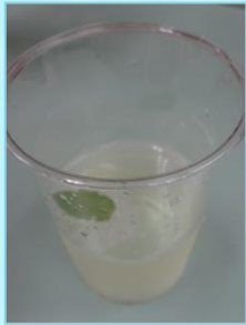
ウェルカムドリンクの ミントティー です。