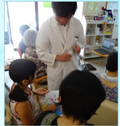
ハッカ油 や メントール を実際にみました。