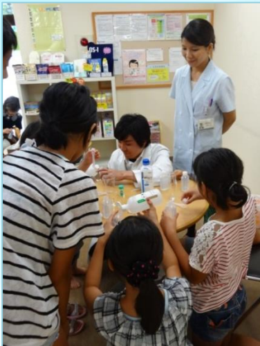
ハッカ油を使って 虫よけ スプレー を作ります。