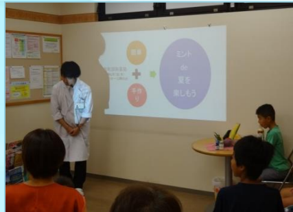
薬局長 の挨拶から 始まりました。