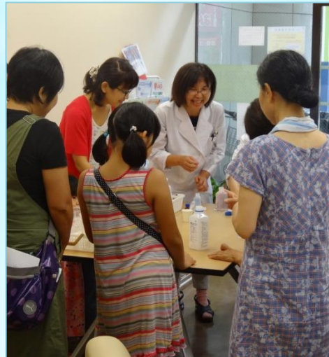
分量を変えれば 制汗 スプレー に早変わり！