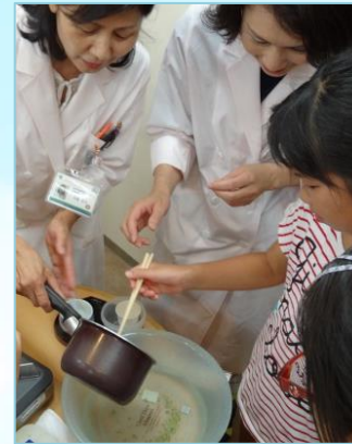
ハッカ油は食べものにも使えます。 爽やかな味の ハッカ飴 を作りました。